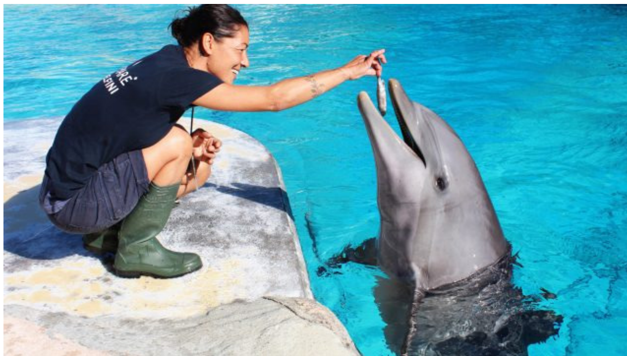
Primi gustosi assaggi di autunno