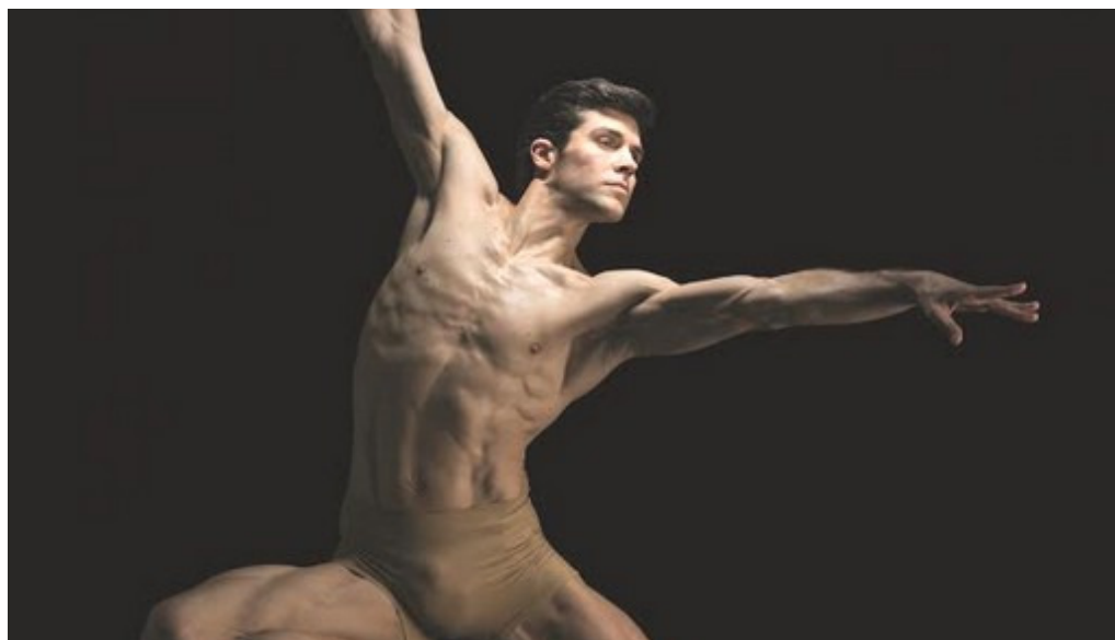
Teatro Galli. E' la serata di Roberto Bolle