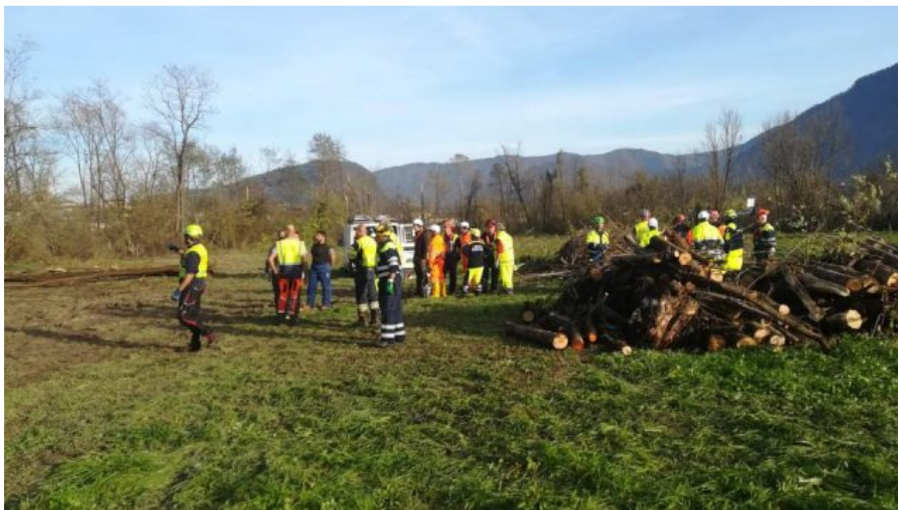
Volontari delle Protezione Civile in soccorso nel bellunese