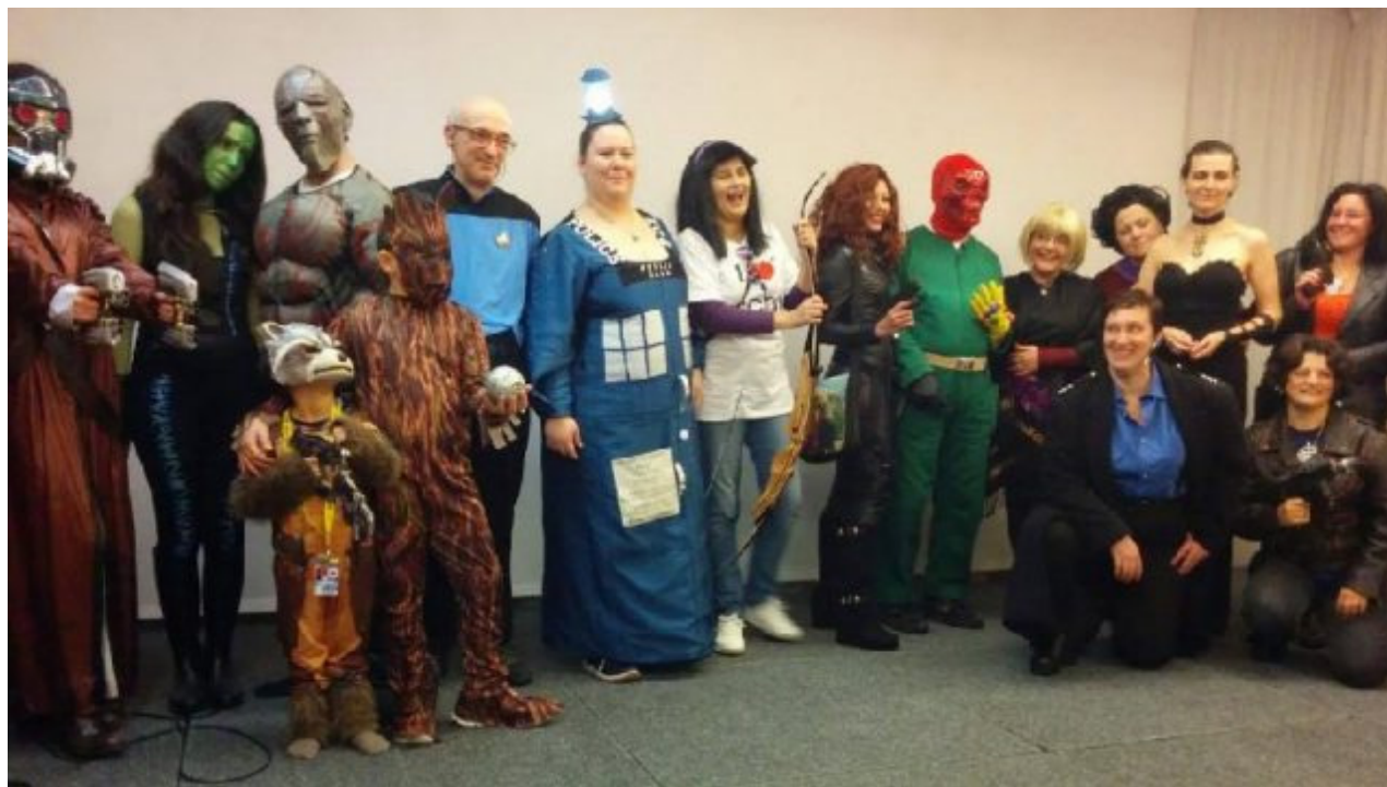
A Riccione atterra la Reunion dello Stic