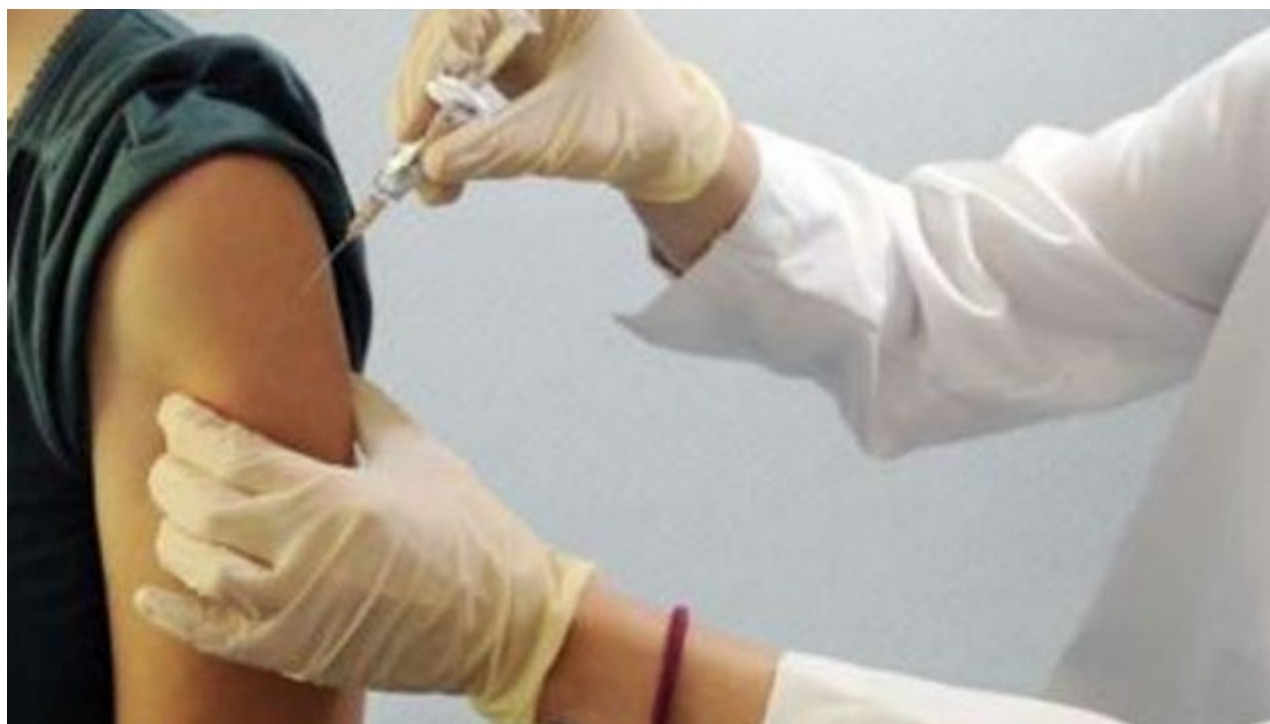
Influenza, pochi vaccinati tra medici e infermieri. Grossi: manca percezione rischio